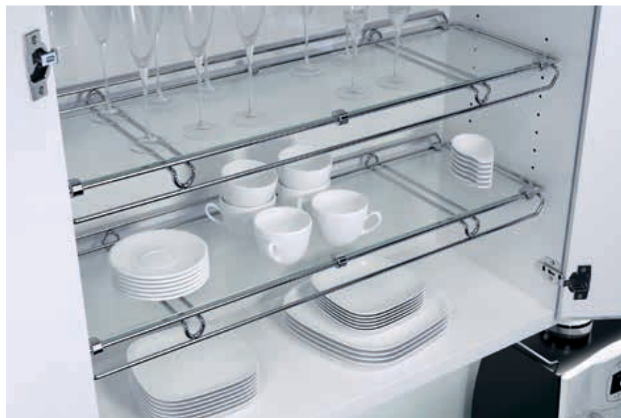
EX. ESTRUTURA COM FUNDO EM VIDRO